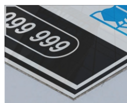
SÁNDWICH ALUMINIO BL/BL 3mm - Dibond