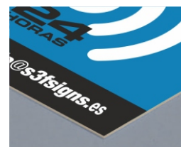
PEGATINAS DE VINILO