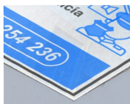
POLICARBONATO ESPEJO PLATA